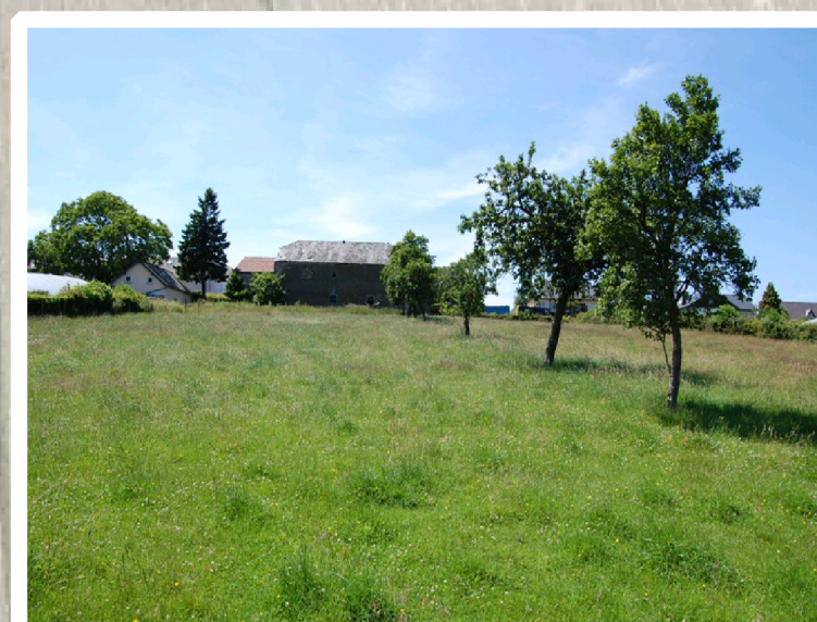
- ancienne ferme à démolir -